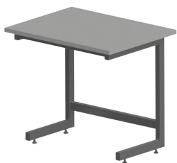
C Kovová podnož tvar "C"