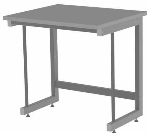
Kovová podnož tvar C doplnená o výštku a pohľadovým krytom - CH