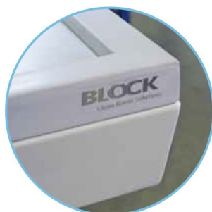
Detail pohľadovej hrany