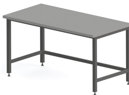
H Kovová podnož tvar "H"